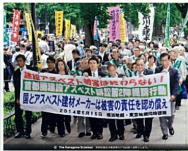
▲ 建設アスベスト訴訟