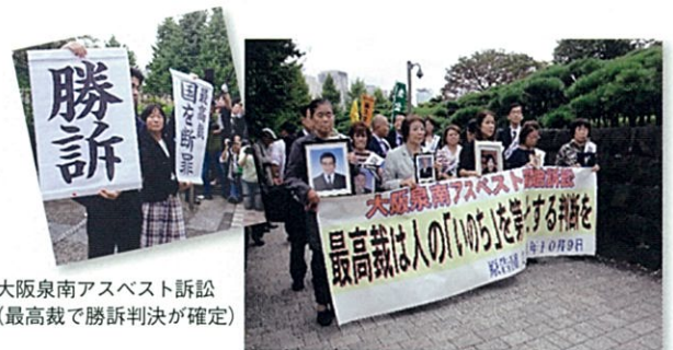
大阪東南アスベスト訴訟 (最高裁で勝訴判決が確定)