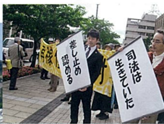
▲ 大飯原発差し止め訴訟