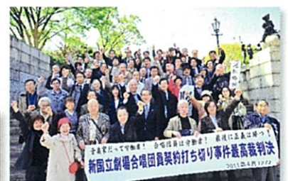
▲ 新国立劇場事件 (最高裁で逆転勝利判決)